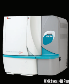
WalkAway 40 Plus

Microscan responde a las necesidades de atención eficaz de los pacientes mediante resultados automatizados rápidos de ID/AST sin reducir la exactitud.