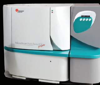
WalkAway 96 Plus