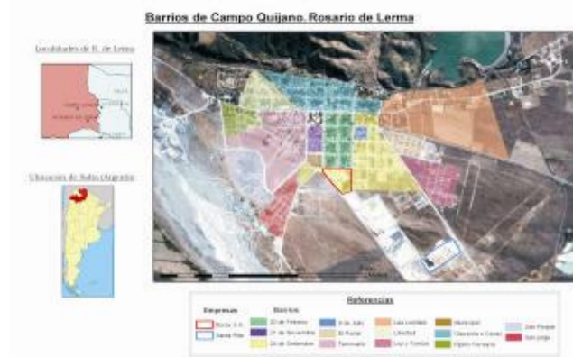
Tabla II. Número de casos de las enfermedades (C) y prevalencia (P) por barrio según los registros del Hospital de Campo Quijano, durante el año 2005. Los datos de población se estimaron para 2005 según se detalló en materiales y métodos.